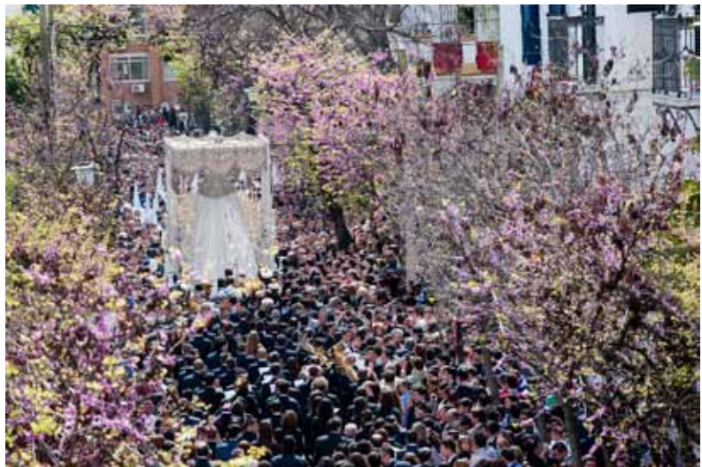
Ríos de gente y plata en su palio, la Virgen avanza por Río de la Plata

En este punto, miembros del Excelentísimo Ayuntamiento de Sevilla, se dirigieron al Celador