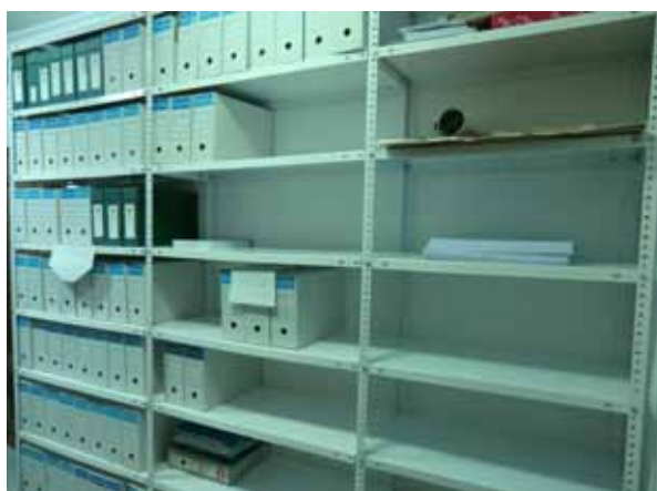
Imagen del nuevo archivo

Por otra parte, el Fondo correspondiente a la Hermandad Sacramental cuenta con 2 unidades de instalación.