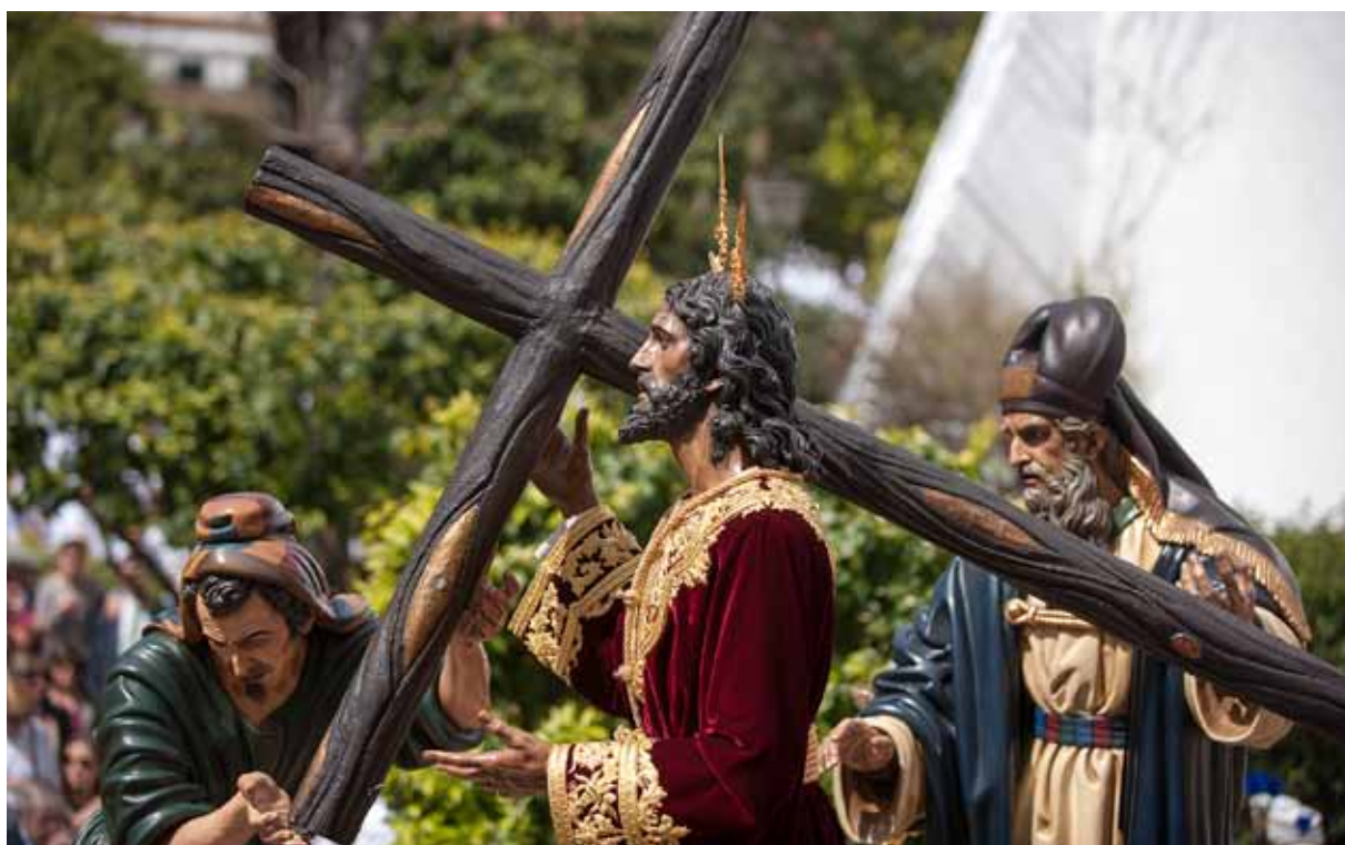
El Señor de La Victoria mira al cielo de El Porvenir