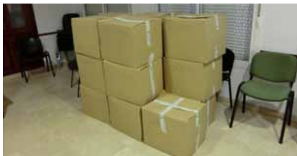
Comida embalada para su entrega a los necesitados

La Hermandad además forma parte de "Acción Social Conjunta de las Hermandades del Domingo de Ramos" con la que colabora con