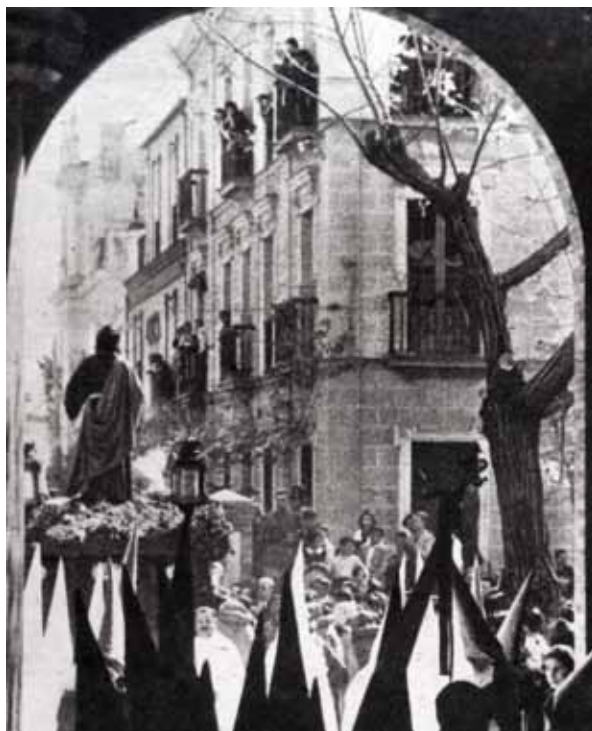
Imagen de la primera salida procesional

Pero no sólo podemos estar pendientes de tan importante aniversario. En la Hermandad no perdemos de vista la situación actual de en la que nos encontramos. Por ello las puertas están abiertas para cuantos hermanos necesiten ayuda. En los próximos días ponemos en marcha el "Proyecto Victoria", un ambicioso plan para ayudar a hermanos en situación de desempleo y que quieren buscar recursos en nuevas fuentes. La Bolsa de Caridad de Nuestro Padre Jesús de la Victoria está más viva y presente que nunca; donde sea menester, allí estará. Pero además