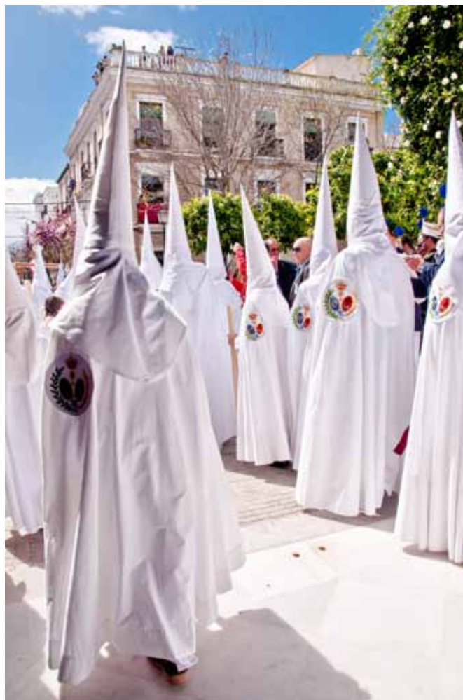
Nazarenos saliendo a la luz del Domingo de Ramos.

Sois vosotros, nazarenos de La Paz, los pargaminos escritos en la memoria del Domingo grande de la ciudad más hermosa del mundo. Sois vosotros la luz y el esplendor, la certeza, la brisa sutil que armoniza el corazón. Porque el corazón de Sevilla no toma la velocidad real de su crucero hasta que no comprueba vuestra presencia en los adoquines calientes de una tarde memorable.