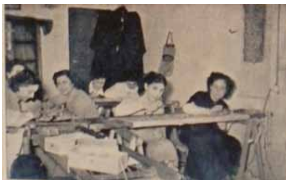
Bordadoras inmersas en su tarea.