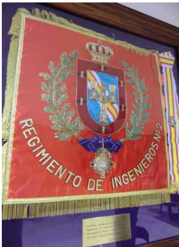
Banderín donado por el Regimiento de Ingenieros nº 2, Hermano Protector de la Hermandad de La Paz. Donado en 1995.

Después, a lo largo de su carrera musical, siguieron infinidad de obras, y temas entre los que destacamos: