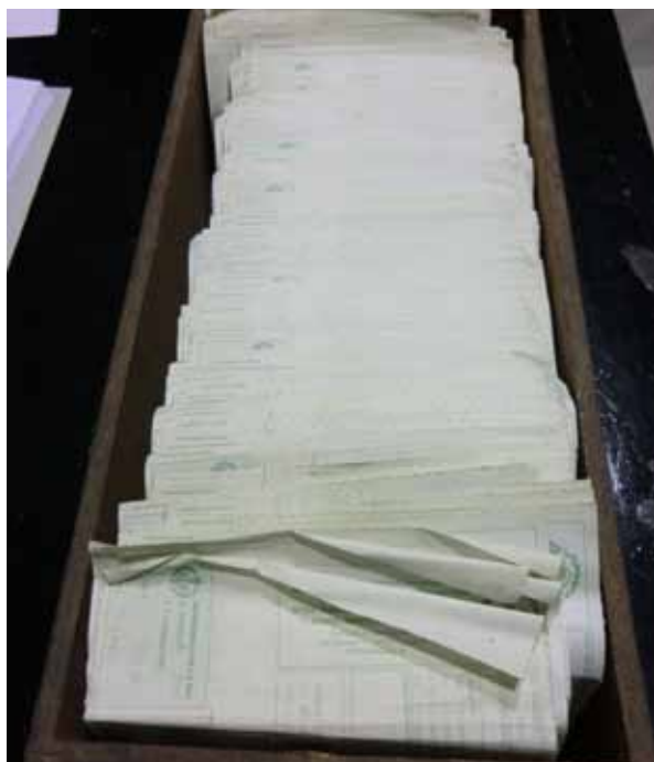
Cajonera con recibos de hermanos

Tras analizar lo que restaba de la previa ordenación del Archivo y respetando siempre el principio de procedencia, el tratamiento archivístico propiamente dicho se inició procediéndose a las operaciones de identificación y clasificación de la documentación. Para ello hubo de realizarse un estudio previo del funcionamiento de la Hermandad, sus órganos, sus actividades, funciones y los documentos que de ellas se derivan, con el objetivo de determinar el Cuadro de Clasificación para la organización del fondo, paso primero para su posterior ordenación y descripción.