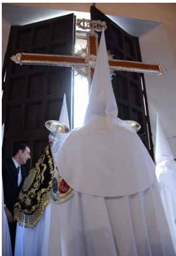
La Parroquia de San Sebastián abre sus puertas para que salga la Cruz de Guía.

En los días previos al Domingo de Ramos el equipo del Diputado Mayor de Gobierno, trabajó para que todo estuviera en perfecto estado para