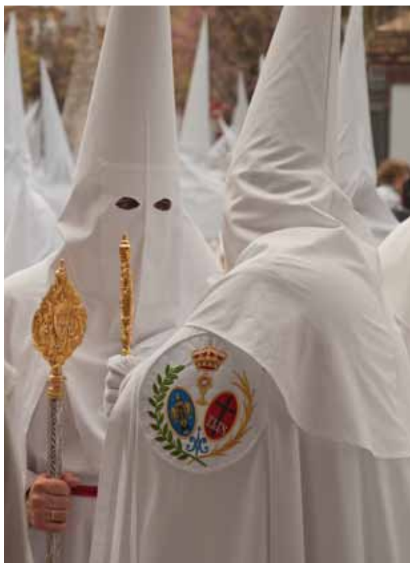
El Diputado Mayor de Gobierno organizando la Cofradía

También quiero que conste en este informe, mi petición de disculpas a todos los hermanos de la Paz por los desajuste que pudieran haberse producido el pasado Domingo de Ramos, de los que el único responsable es este Diputado Mayor de Gobierno, con el compromiso de que ya estamos trabajando para que el año que viene no se produzcan. ■