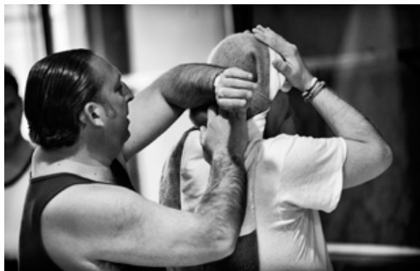
Costaleros ajustándose la ropa.

Y llegó el ansiado día, Domingo de Ramos. Sol de rigor, calor, nervios, ansiedad, el bo-