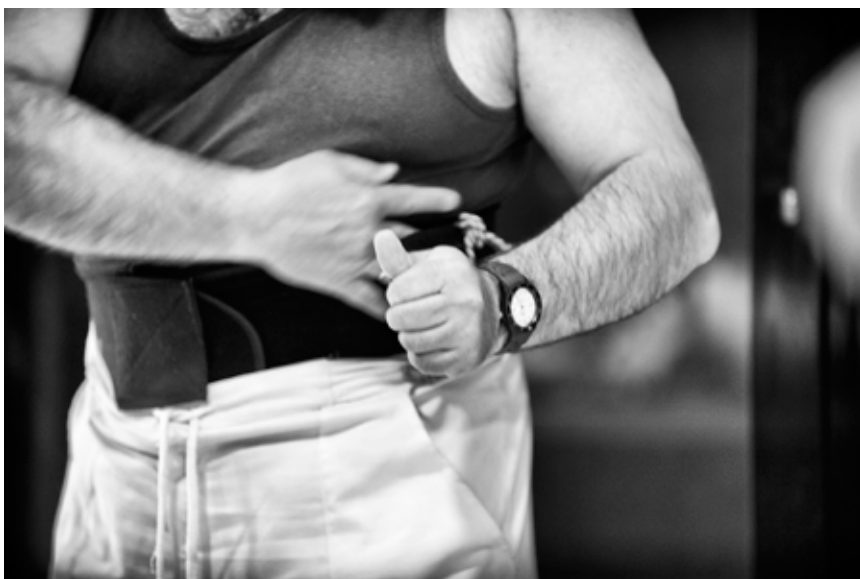
Costaleros fajándose.