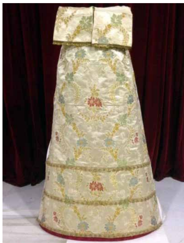
Saya de espolín (S. XVIII) recientemente restaurada por nuestras hermanas

Otro de los proyectos realizados por nuestro taller, ha consistido en la reutilización del Escudo bordado que formaba el antiguo bacalao. El cual presentaba malas condiciones estructurales y de conservación, por lo que se decidió darle un nuevo uso y reutilizar los magníficos bordados realizados por el Taller de sucesores de Elena Caro, consistente en un escudo bordado en plata sobre tisú de plata, este siendo un tejido muy delicado, ya que sus hilos de plata se oxidan y envejecen debido ante cambios bruscos de temperatura y de humedad. El mal estado del tejido que presentaba desgarramientos y abombamientos por el paso del tiempo, es por lo que se decidió pasar los bordados a terciopelo, teniendo en cuenta de que el escudo lo forman diferentes piezas compuestas de varias partes, de forma que se bordan por separado y se van montando sucesivamente. Existiendo varias capas en el bordado, con la idea de crear luces y sombras, y para diferenciarlo uno de otro. Lo cual produjo varios inconvenientes a la hora de descoserlo del tejido. Este nuevo escudo formará parte del tapete de la mesa de cultos de nuestra hermandad.