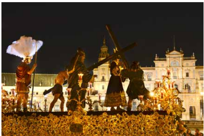
Misterio del Señor de la Victoria de noche por la Plaza de España.

El Domingo de Ramos se vivía en mi familia como la de cualquier otra familia de Triana de los años 60 y 70. La primera cofradía que se veía era la Estrella. Después íbamos al centro a sentarnos en una silla y ver algunas cofradías más. Algunos años, mi padre cuando llegábamos a casa de regreso, me cogía y me llevaba a ver alguna cofradía de noche, mi madre y mis hermanos se quedaban en casa. Mi primer recuerdo de la Hermandad de la Paz es el Paso de la Virgen por la Plaza de España de noche, creo recordar, con la fuente con luces de colores. Después cuando comencé a salir con los amigos unos años íbamos a la salida y otros al Parque por la noche. En los últimos años la he visto por el Postigo y a la llegada a la Catedral. Es de las hermandades que me gusta ver en sitios amplios y con sol. ■