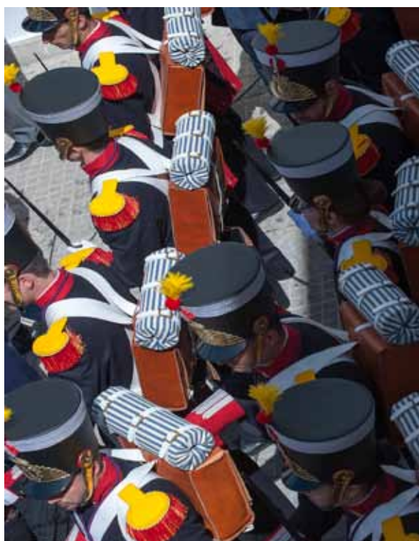
Escuadra de Gastadores del Arma de Ingenieros con uniforme de época el pasado Domingo de Ramos.

La marcha en cuestión, como todas las de este autor, sigue el estilo fiel de marcha militar; de cornetas, fuerte de bajos y trío final. Tienen el sello típico de marchas compuestas por músicos militares, pero ninguna logró "romper" o "calar" en el público. En Sevilla nunca estuvo valorado a pesar de que algunas de sus obras sean catalogadas como auténticas maravillas de la música procesional, es el caso de "La Conquista de Sevilla".