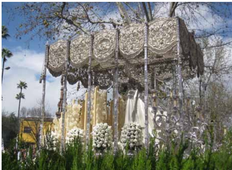
La Virgen de La Paz abandona su barrio para adentrarse en el parque.