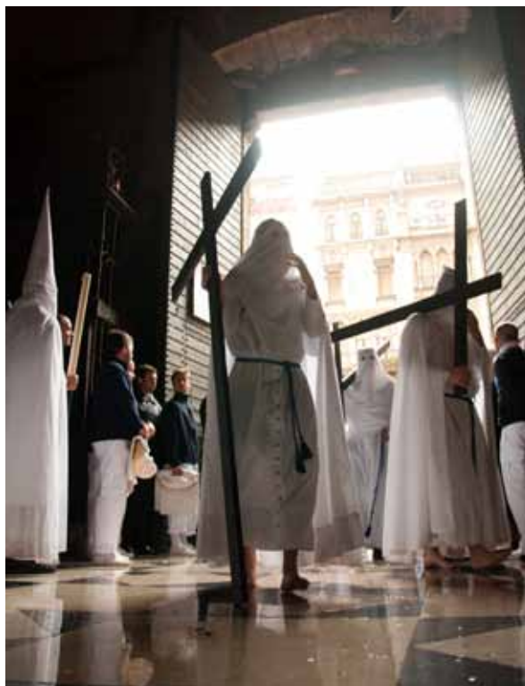
Tramo de penitentes entrando en la Catedral en pleno aguacero.