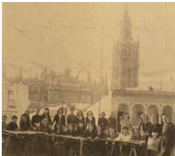
Integrantes del taller Ntra. Sra de La Paz con la Catedral al fondo.

Padilla realizaría también para nuestra Hermandad la túnica bordada de Nuestro Padre Jesús de la Victoria y dos Sayas que forman parte del ajuar de nuestra Madre. También bordó para numerosas hermandades de Sevilla como por ejemplo: en la década de los 60 el palio de San Gonzalo; para la Hermandad de San Benito realizó el senatus y el antiguo manto rojo de la Virgen de la Encarnación en 1962.