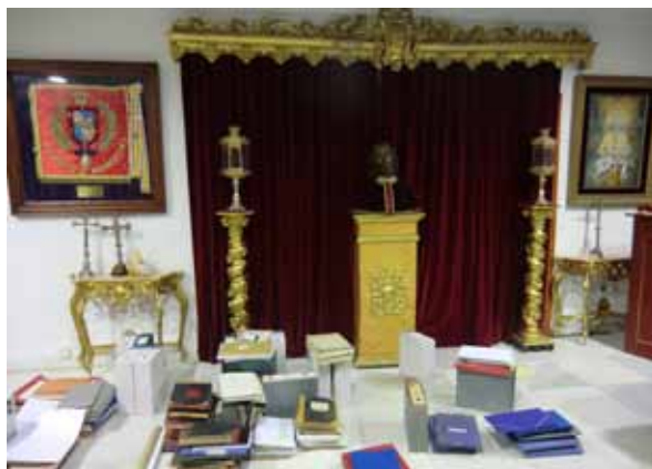
Sala Capitular durante los trabajos

Aunque teníamos constancia de que el Archivo había sido parcialmente organizado años atrás, siendo su documentación descrita someramente e incluida en carpetas para una me-