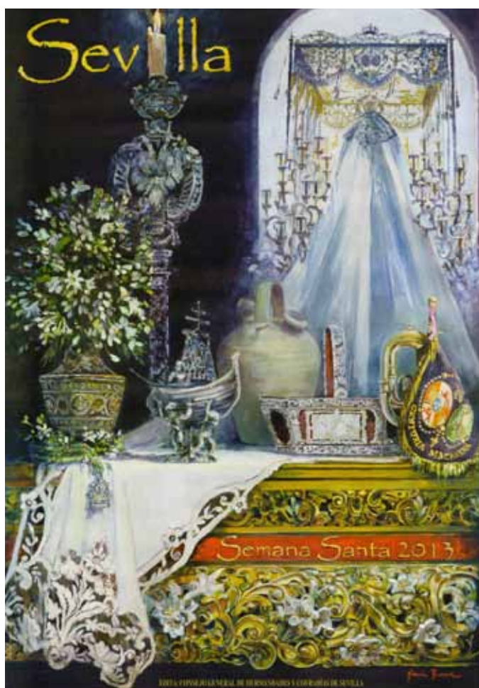
Cartel del Consejo de HH. y CC. de Sevilla 2013

Jamás olvidaré el pasado Domingo de Ramos. Hubo un momento en que tuve la sensación de que mi obra tomaba vida. Aún recuerdo el sonido de las bambalinas y el respetuoso silencio hasta que la Virgen de la Paz sale al cielo de Sevilla.