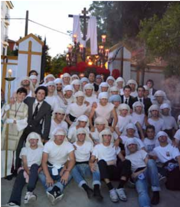
Cuadrilla de costaleros delante del paso de la Cruz de Mayo

L El 1 de junio volvió a procesionar por las calles del barrio. La Cruz de Mayo que anualmente organizamos los jóvenes de la Hermandad.