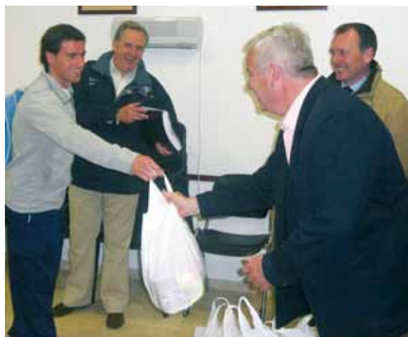
Recogida de alimentos de los costaleros y capataces

Durante la Navidad se volvió a poner en marcha la Campaña " Participa con tu Participación ", animando a los hermanos a donar su participación de la Lotería de Navidad, que había sido premiada con el reintegro a la Bolsa