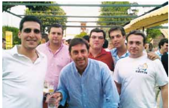
Asistentes al "Pescaito Solidario"

En el mes de Abril y Mayo, la Bolsa de Caridad con la ayuda de nuestras hermanas organizó la rifa de una pintura de Nuestro Padre Jesús de la Victoria para recaudar fondos que fueron